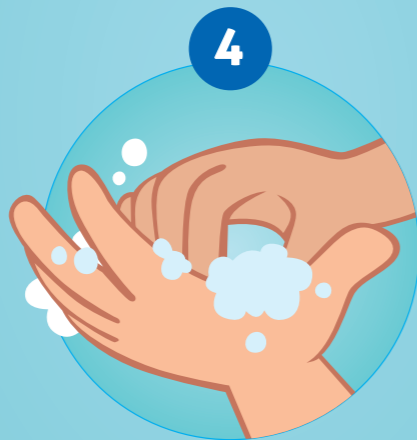
4 DE VINGERTOPPEN EN DE BEIDE ZIJDEN VAN DE HANDEN INWRIJVEN ...