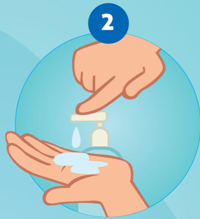
2 ZEEP NEMEN