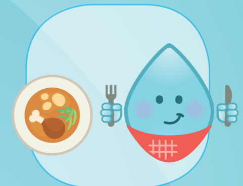
VOOR EN NA EEN MAALTIJD