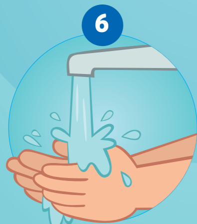
6 DE HANDEN AFSPOELEN