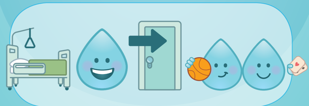
OM DEEL TE NEMEN AAN GEMEENSCHAPPELIJKE ACTIVITEITEN

DE PARTNERS VAN DE CAMPAGNE "U BENT IN GOEDE HANDEN"