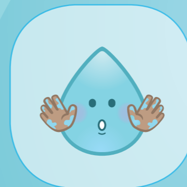
BIJ BEVULDE HANDEN