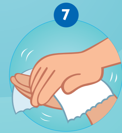
7 DE HANDEN ZORGVULDIG DROGEN