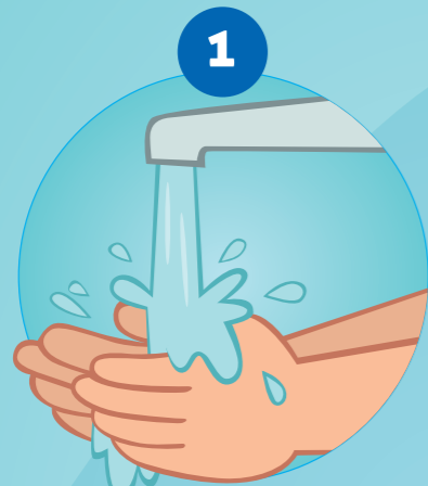
1 DE HANDEN BEVOCHTIGEN